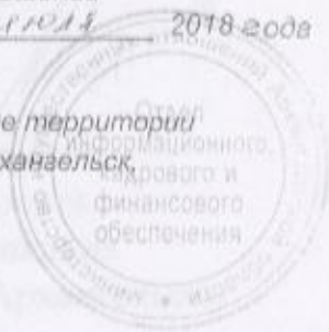
Схема расположения земельного участка или земельных участков на кадастровом плане территории В кадастровом квартале 29:22:012001, расположенных по адресу: Архангельская обл., г. Архангельск, Маймаксанский территориальный округ, по улице Победы.